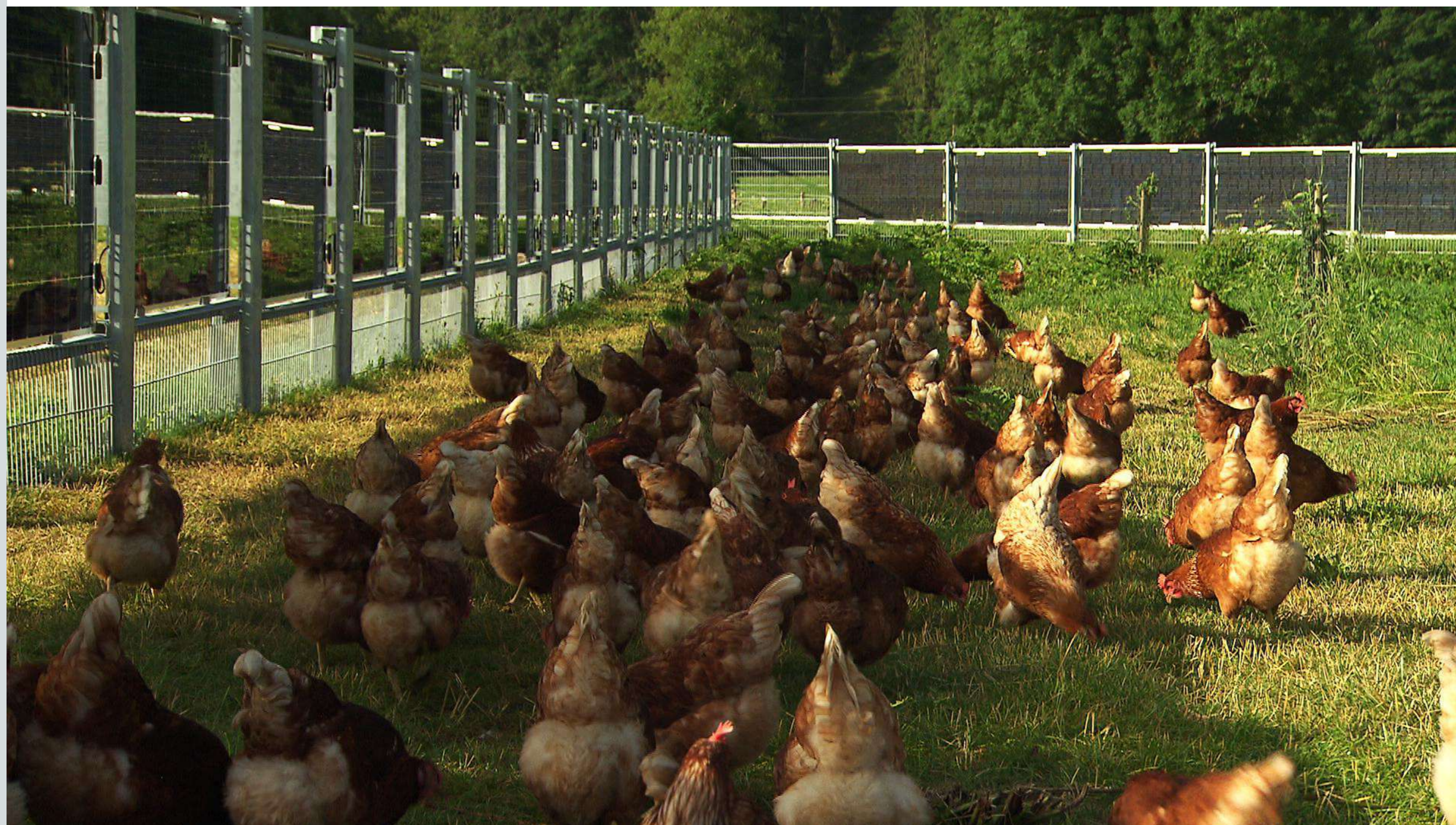
Die 1.000 Hühner in St. Martin bei Lofer sind jetzt mit PV-Paneele eingezäunt